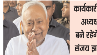
कार्यकारी अध्यक्ष बने रहेंगे संजय झा