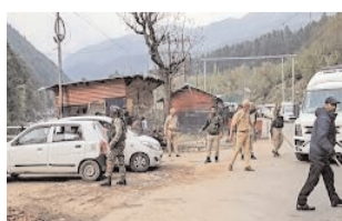
■ अमी मी साफ दिखाई देते हैं सीजफायर उल्लंघन के निशान

पर इतना जरूर है कि लाइन ऑफ कंट्रोल के पास जम्मू-कश्मीर के कुछ हिस्सों में तनाव बढ़ने के एक साल बाद भी, जिन गांवों को हिंसा का सबसे ज्यादा नुकसान झेलना पड़ा था, वे अभी भी शारीरिक, आर्थिक और भावनात्मक रूप से खुद को फिर से खड़ा करने के लिए संघर्ष कर रहे हैं। ऐसे ही एक गांव उत्तरी कश्मीर के बारामुल्ला जिले में, खासकर उड़ी सेक्टर में, मई 2025 में हुए सीजफायर उल्लंघन के निशान अभी भी साफ दिखाई देते हैं। टूटे-फूटे घर जिनकी छतें टिन से पैच की हुई हैं, बंद या आधे-अधूरे बनी हुई दुकानें, और जंग