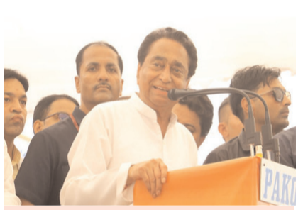
■ 27 अप्रैल को विधानसभा का विशेष सत्र

भोपाल, 22 अप्रैल (एजेंसियां)। मध्य प्रदेश में महिला आरक्षण बिल को लेकर सियासी घमासान तेज हो गया है। राज्य में 27 अप्रैल को एक दिवसीय विशेष विधानसभा सत्र बुलाया गया है, जिसमें इस मुद्दे पर चर्चा होगी। इस बीच सत्तारूढ़ भारतीय जनता पार्टी और विपक्षी दल कांग्रेस एक-दूसरे पर जनता को गुमराह करने के आरोप लगा रहे हैं। यह बहस अब संसद से निकलकर राज्य की राजनीति में पहुंच गई है, जहां नेताओं के बीच तीखी बयानबाजी हो रही है। जैसे-जैसे सत्र की तारीख नजदीक आ रही है, भोपाल में विवाद बढ़ता जा रहा है और महिला आरक्षण राज्य की राजनीति का बड़ा मुद्दा बन गया है। कांग्रेस के वरिष्ठ नेता और मध्य प्रदेश के पूर्व